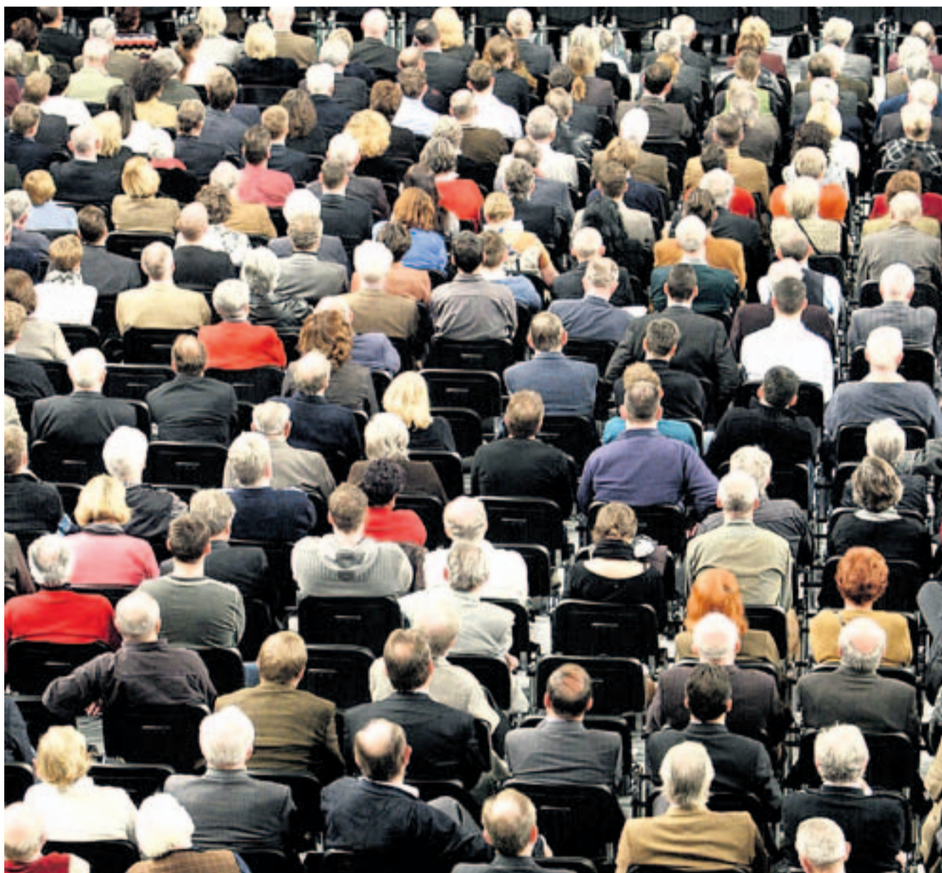
Bei der Abzockerinitiative wie beim Gegenvorschlag geht es darum, Selbstbedienungsmechanismen zu unterbinden.