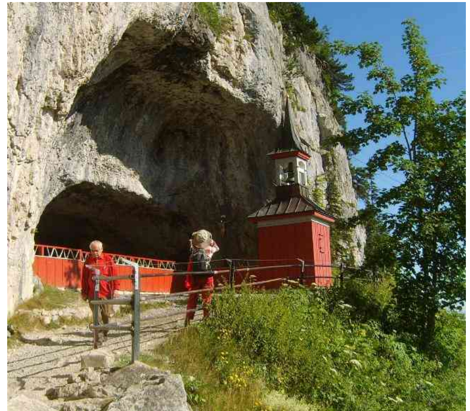
Wildkirchli am Eingang der Höhle

am Samstag, 15. Juni 2013 (Verschiebedatum - bei sehr schlechtem Wetter - 22. Juni)