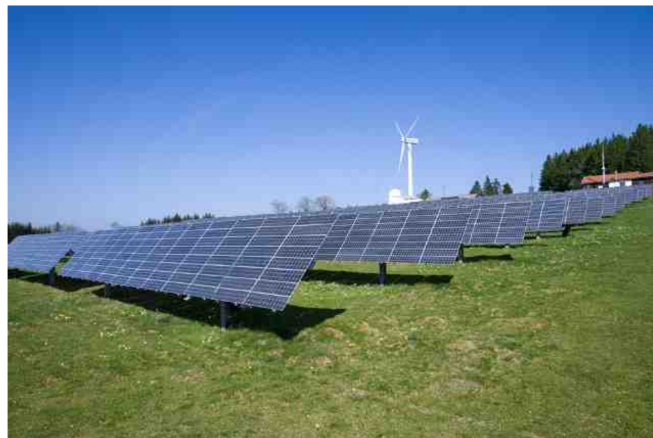
Energiegewinnung auf dem Mont Soleil

(Verschiebedatum - bei sehr schlechtem Wetter - Sa. 4. Juli)