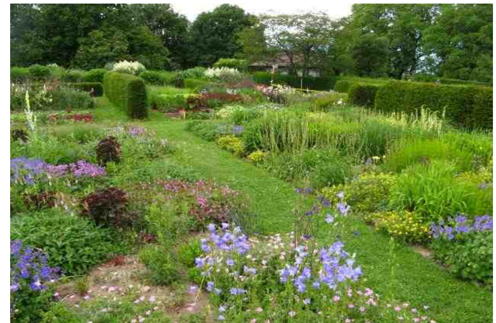
Botanischer Hochschulgarten in Wädenswil

Bitte um Mitteilung an: remy.holenstein@holon-net.net